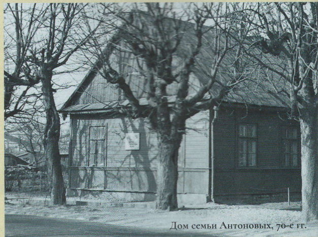
Дом семьи Антоновых, 70-е гг.