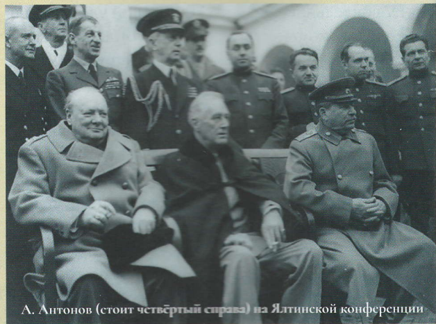
А. Антонов (стоит четвёртый справа) на Ялтинской конференции

«Родители стремились воспитать в нас с братом чувство прекрасного, любовь к окружающему миру, ко всему живому. Начиналось это со слушания сказок. Этому же способствовали прогулки по живописным окрестностям Гродно и Острога, и жизнь летом в лесу в военных лагерях, и книги известного натуралиста, певца и защитника природы Дмитрия Кайгородова. Стены нашего дома украшали копии картин известных русских живописцев. Повсюду были цветы – их с большой любовью выращивала бабушка. В доме был граммофон, из которого часто звучали голоса Шаляпина или Сабинава... Тогда Аля – так его звали в се-