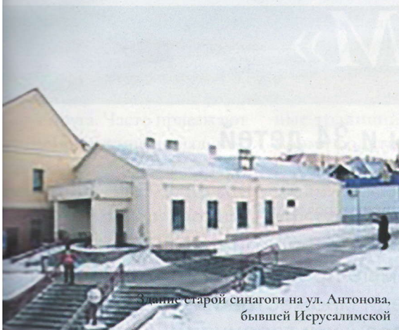
Участок старой синагоги на ул. Антонова, бывшей Иерусалимской