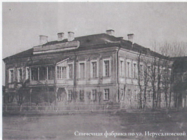
Спичечная фабрика по ул. Иерусалимской